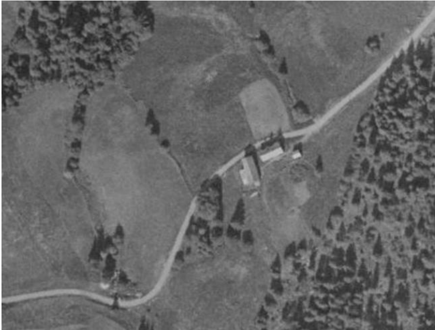
Flyfoto 1958. Gammelbygget står. Revet og bygd nytt mellom 1973 og 2002.